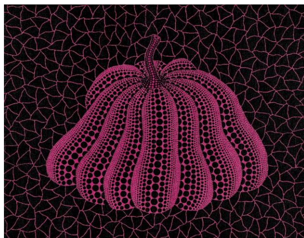
二十一世紀藝術日間拍賣最高成交價拍品