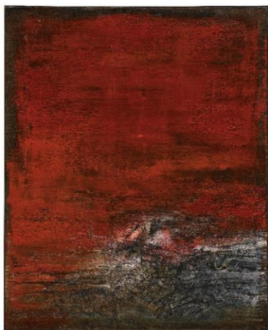
二十世紀藝術日間拍賣最高成交價拍品