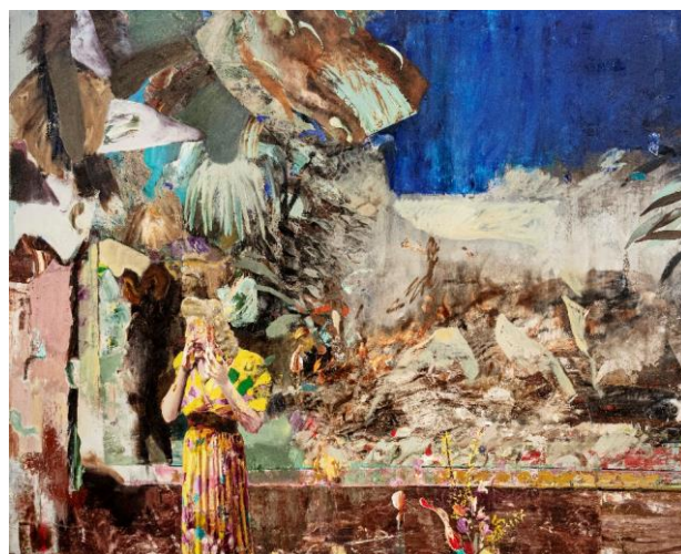
藝術家世界拍賣紀錄