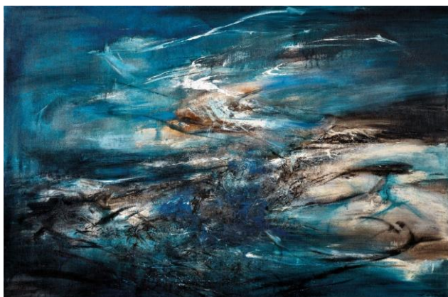
晚間拍賣最高成交價拍品