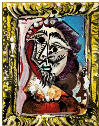
佳士得亞洲拍賣史上最高價畢加索作品